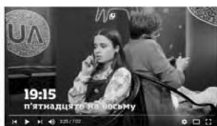
Лайфхак українською. Як правильно відповісти на запитання «котра година?»

– Перегляньте запропоновані відео (UA: Перший – «Лайфхаки українською» та «EdEra»). Напишіть невеличкий сценарій, розподіліть ролі та змонтуйте запис на одну з тем, яку ви обрали на початку уроку.