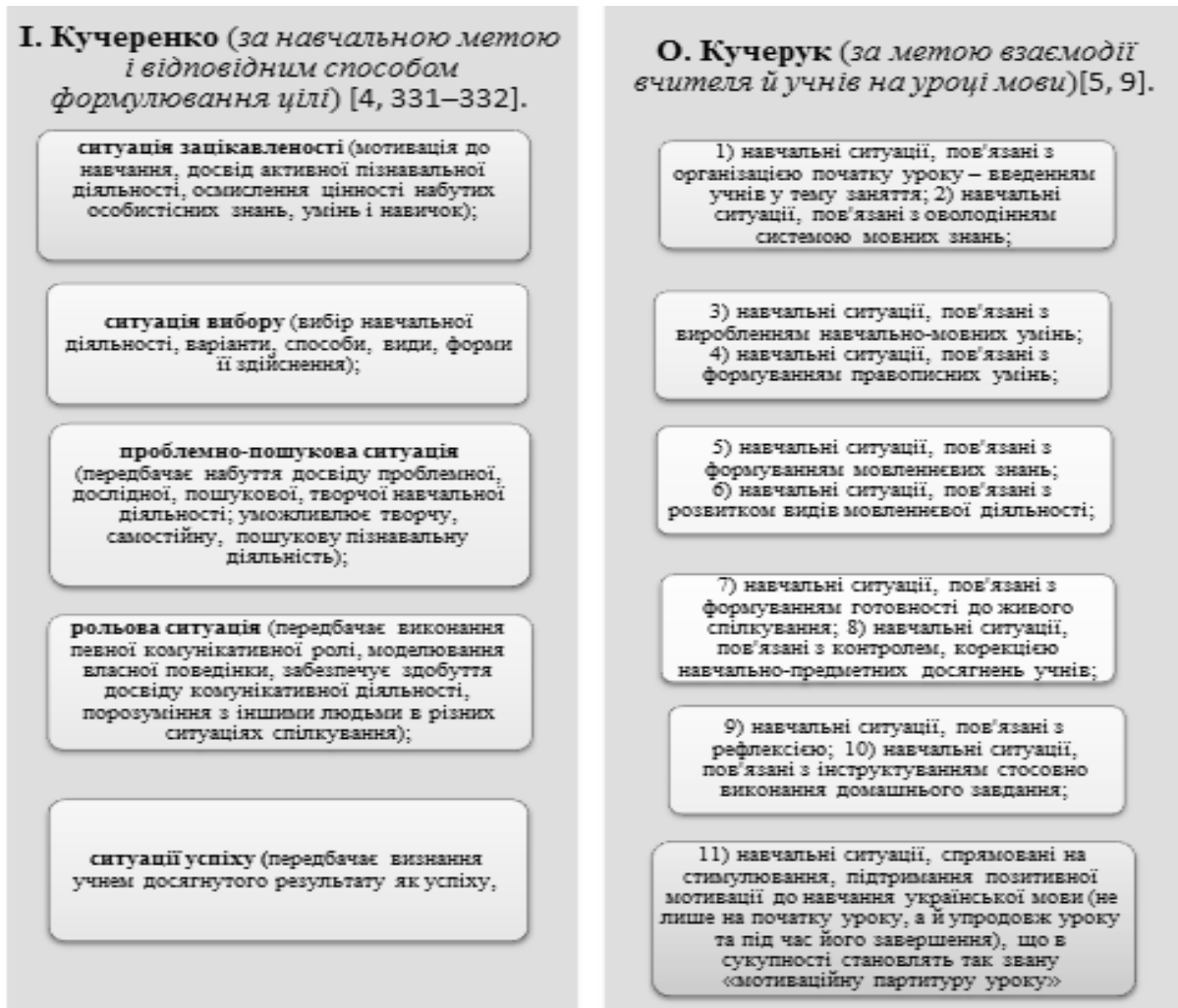
Рис. 2. Типи навчальних ситуацій (за І. Кучеренко, О. Кучерук)

Щодо особливостей використання особистісно орієнтованої навчальної ситуації, то узагальнимо думки науковців і звернемо увагу на те, що «у процесі застосування навчальної ситуації учитель дає поштовх до розвитку мовної особистості учня та можливість зайняти індивідуальну позицію;