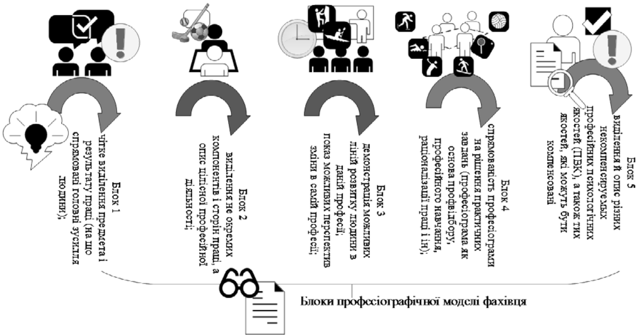
Рис. 2. Основні структурні компоненти професіографічної моделі фахівця (за А.К. Марковою)