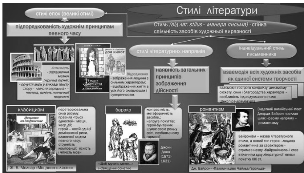
Рис. 1. Інфографіка «Стилі літератури»