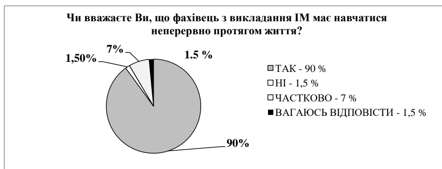
Рис. 1. Результати відповідей учителів ІМ та викладачів ІМ

Також особливої уваги потребують результати відповідей респондентів про якість підготовки майбутніх учителів ІМ сьогодні (див. рис. 2). Учителі ІМ та викладачі ІМ (55,8%) зазначили, що частково задоволені фаховою підготовкою, 16,3% респондентів висловили думку про незадовільний стан підготовки фахівців. Усе це підтвердило недостатньо якісний стан професійної підготовки майбутніх учителів ІМ.