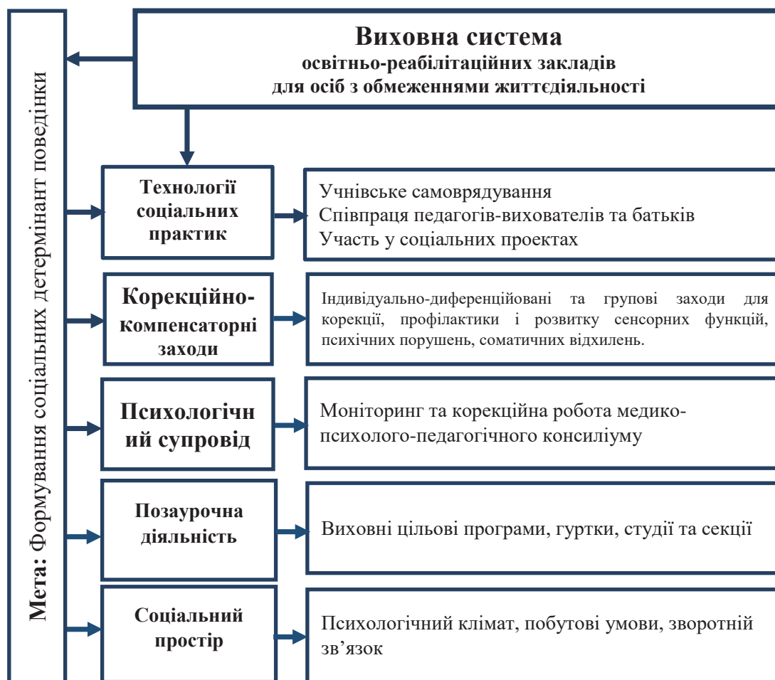
Рис. 1. Виховна система освітньо-реабілітаційних закладів для осіб з обмеженнями життєдіяльності

соціальних детермінант її поведінки й інтеграцію у суспільство та навчальне середовище».