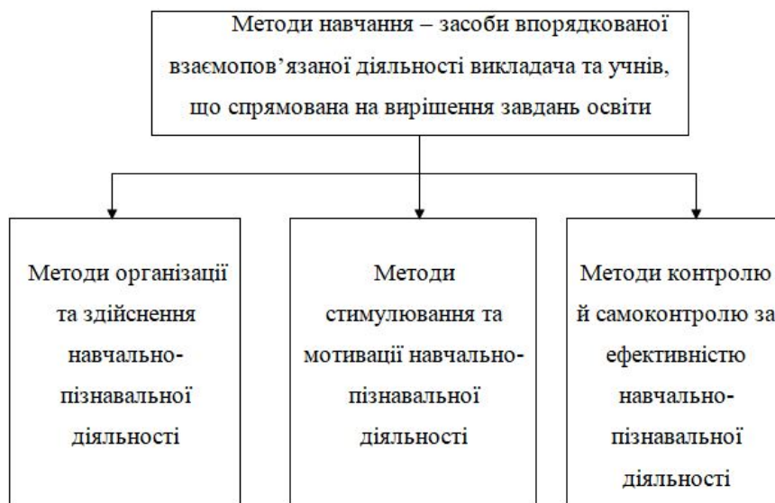
Рис. 1. Класифікація методів навчання (за Ю. Бабанським)

У дослідженнях І. Толоч [11] доводить, що під психолого-педагогічною компетентністю військового фахівця оперативно-тактичного рівня підготовки вважається система психолого-педагогічних знань, умінь і навичок, оволодіння якими дасть змогу забезпечити виконання двоєдиних цілей