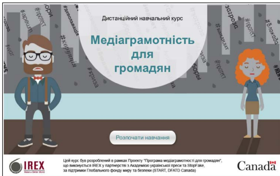
Рис. 2. Стартова сторінка дистанційного курсу «Медіаграмотність для громадян» ( http://irex.mocotms.com/ml_web/story_html5.html )

базових знань у сфері медіа, ознайомлення користувачів з найрозповсюдженішими видами маніпуляцій і пропагандою, а також надання базових інструментів перевірки інформації та критичного мислення.