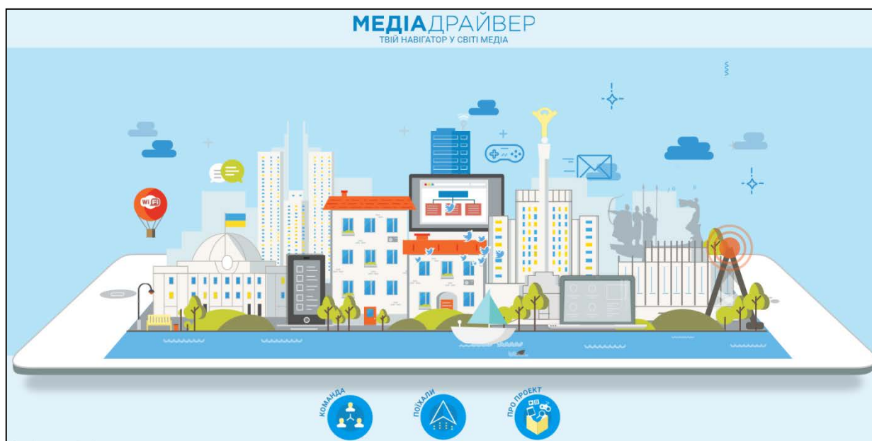
Рис. 3. Головна сторінка онлайн-посібника «МедіаДрайвер» ( http://mediadriverr.online/ )

6. Онлайн-курс «Новинна грамотність» ( https://video.detector.media/special-projects/novynna-gramotnist-i22 ), що має просвітницьку мету і спрямований на поширення медіаграмотності серед населення в умовах воєнного конфлікту.