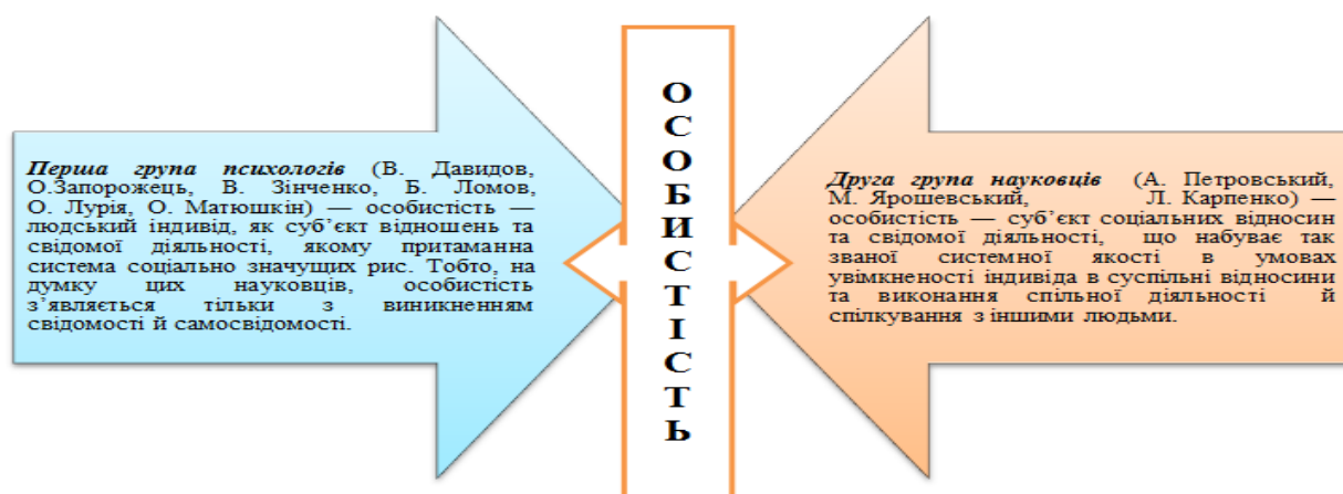
Рис. 1. Напрями наукового визначення поняття «особистість»

Ми розглянемо тривимірну структуру В. Рибалки [8] (див. рис. 2), адже вона вбирає в себе не лише загальнопсихологічні засади, але й аспекти навчання старшокласників, враховує вплив соціальних факторів в умовах здійснення ним діяльності (у нашому випадку навчальної) та спілкування з іншими людьми.