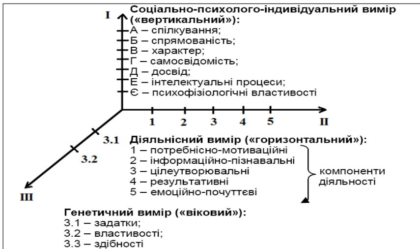
Рис. 2. Тривимірна психологічна структура особистості (за В. Рибалкою)

Перший рівень вказує на те, що особистість – це система, яка постійно перебуває у процесі розвитку, другий рівень реалізується у формі діяльності та спілкування, третій – це генетичний і віковий виміри.