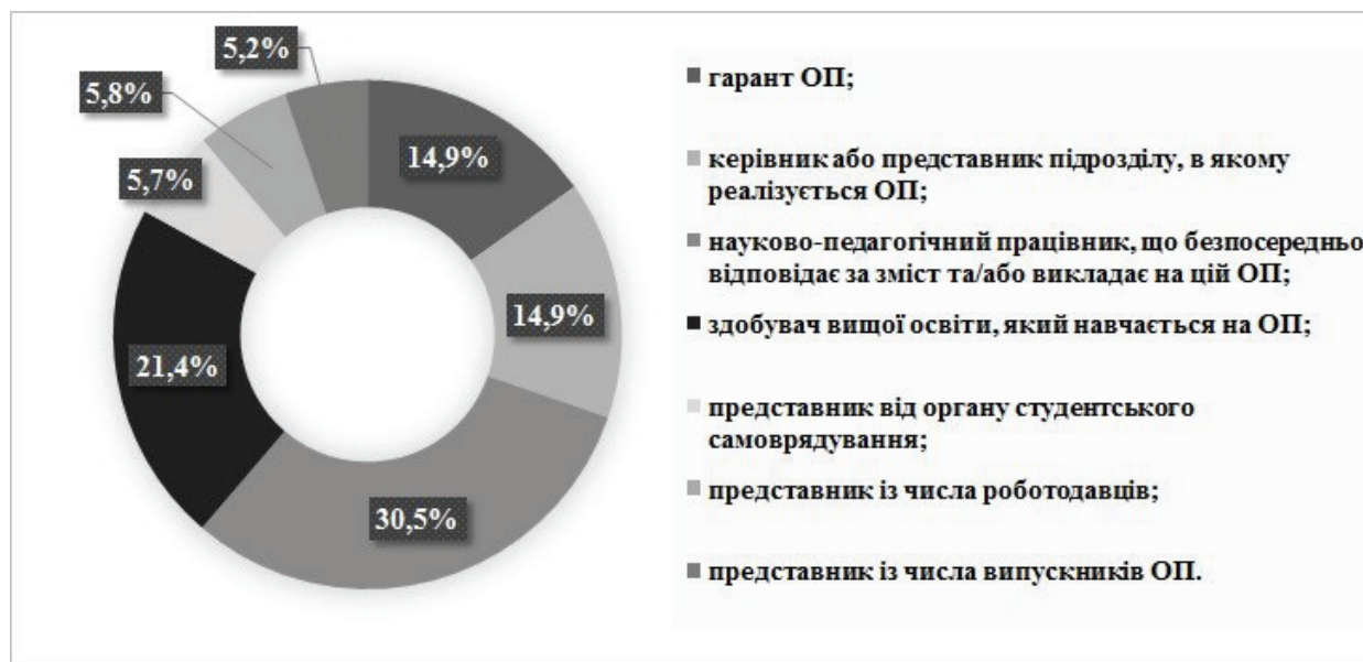
Рис. 1. Розподіл респондентів за категорією представників від Національного університету «Львівська політехніка» (% від усіх наданих відповідей)

Насамперед респондентам було запропоновано оцінити новий акредитаційний процес зага-