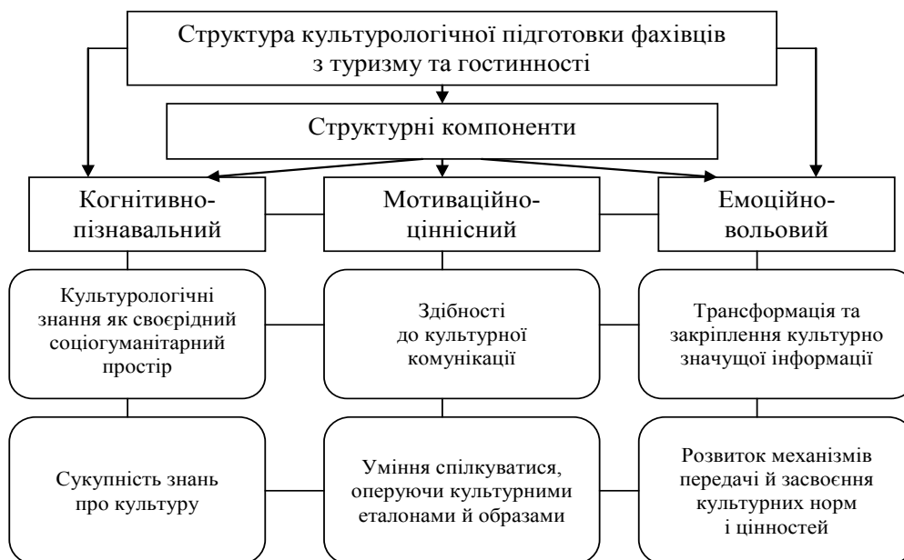
Рис. 1. Структура культурологічної підготовки фахівців з туризму та гостинності

Культура безпосередньо впливає на зміст усіх компонентів туристської освіти. В умовах, коли туризм у сучасному суспільстві стає засобом виховання поваги, сприйняття й розуміння різноманіття різних культур, набуває актуальності культурологічне забарвлення індивідуалізації освітньої траєкторії кожного студента. Посилюються вимоги до технологічно-операційних способів подання навчального матеріалу, передусім художньо-естетичного змісту. Формування емоційно-ціннісного ставлення до духовного спадку людства сприятиме формуванню ціннісних домінант сучасної молоді. У цьому аспекті створюється сприятливий полікультурний простір, у якому домінуватиме міжкультурна комунікація й комунікативні техніки презентації туристичного продукту. Урахування культуротворчих аспектів професійної туристичної діяльності дасть змогу якісно й ефективно інтерпретувати культурологічне знання як своєрідний соціогуманітарний простір.