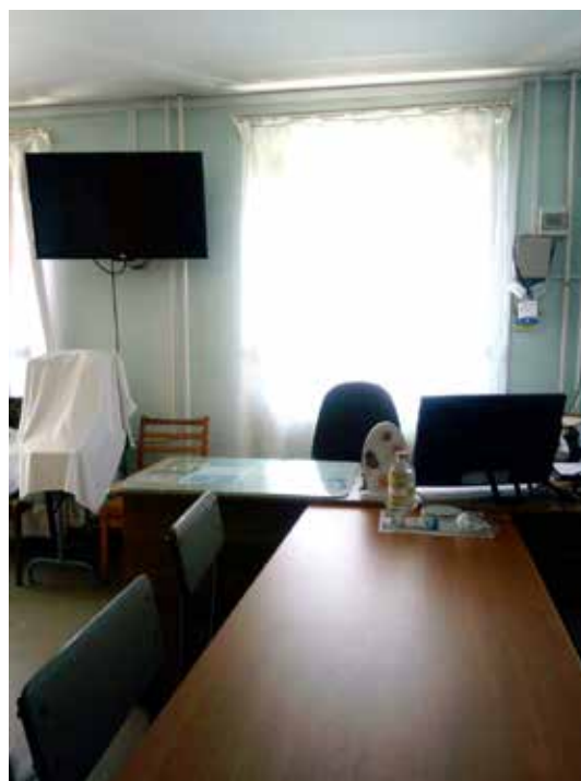
Фото 2. Учбова кімната, оснащена телевізійним передавачем

2. Окрім ПК, учбові кімнати оснащені телевізійними передавачами, розмір екрану яких є достатнім для того, щоб камера ПК могла якісно фіксувати відеокартинку з телевізійного передавача і передавати її для студентів, які у цей час онлайн перебувають на занятті (фото 2).