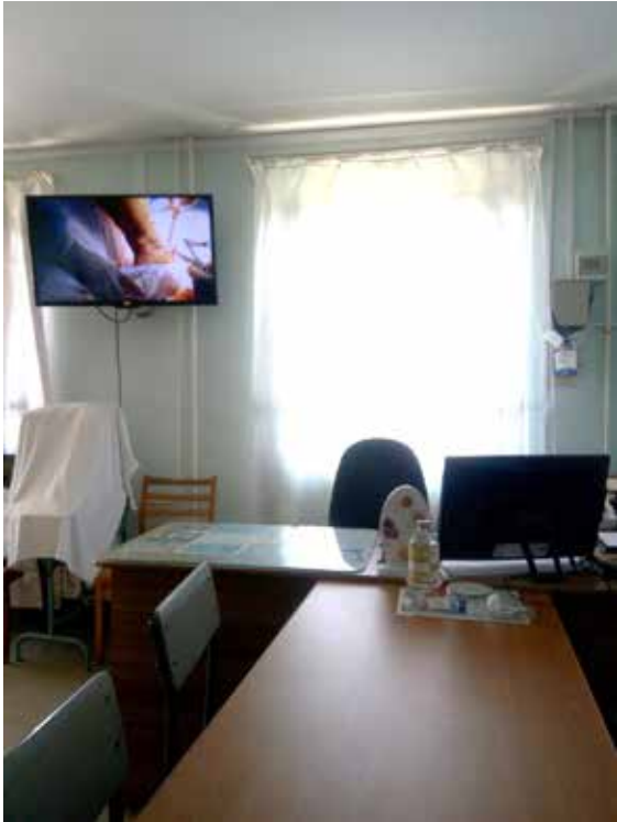
Фото 4. Відеотрансляція оперативного втручання наживо

підготовка хворого до операції, виконання місцевої чи загальної анестезії, підготовка операційного поля, інтубація пацієнта, використання апарату штучної вентиляції легень, здійснення операційного доступу, операційного прийому, виходу з операції, накладання анастомозів, перев'язка судин, методи тимчасової і кінцевої зупинки кровотеч тощо (фото 4).