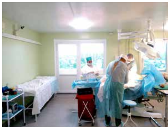
Фото 3. Відеокамера в операційній відділення судинної хірургії

3. Кафедра загальної хірургії закріплена за відділенням судинної хірургії ОКЛ м. Івано-Франківськ, в операційній якого наявна відеокамера останнього покоління, що здатна зближувати фокус зображення на відстань до 50 см від операційного поля пацієнта (фото 3).