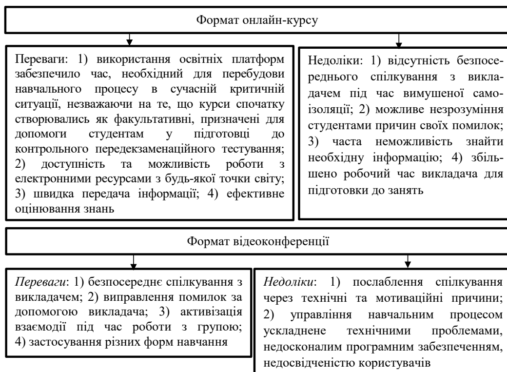
Рис. 3. Формати дистанційної освіти