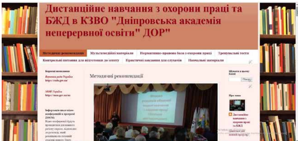
Рис. 1. Блог «Дистанційне навчання з охорони праці та безпеки життєдіяльності» в комунальному закладі вищої освіти «Дніпровська академія неперервної освіти»

Висновки. Підсумовуючи викладене вище, зазначимо, що зворотний зв'язок – це ресурс, який можна і необхідно активно використовувати викладачу в процесі планування та реалізації педагогічного процесу. Важливим надбанням сучасної дистанційної форми навчання є можливість створення електронної платформи для розміщення необхідних навчально-методичних матеріалів; отримання миттєвого прямого і зворотного зв'язку. Обов'язковою умовою ефективності реалізації