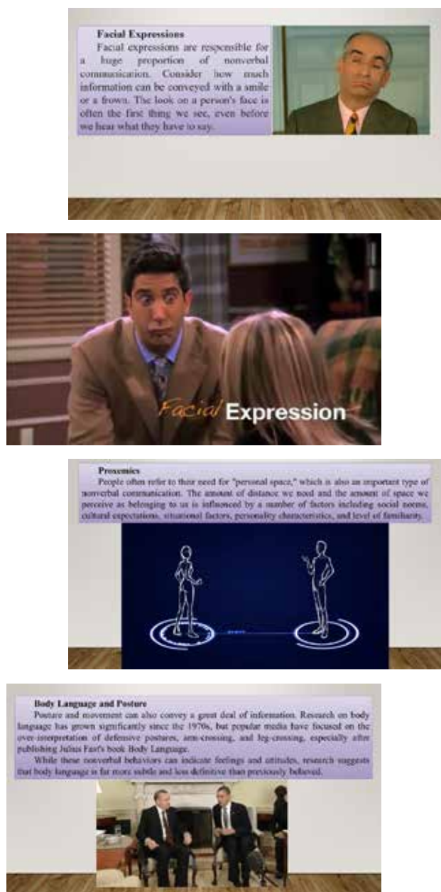
Рис. 1. Слайди лекційного матеріалу

оцінювання кожної з проведених лекцій в балах від 0 (повністю не задоволений/а) до 5 (повністю задоволений/а) за 11-ма позиціями (рис. 2). Також здобувачам було запропоновано скористатися рефлексивною мішенню для оцінювання кожної з лекцій за напрямками: оцінка змісту; оцінка форми, методів взаємодії; оцінка діяльності педагога; оцінка своєї діяльності.