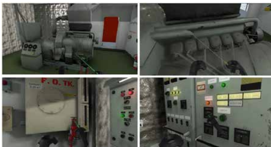
Рис. 3. Проходження процедури «Emergency generator routine maintenance» на симуляторі ВР

Таким чином, залучення нагіту віртуального навчання дозволяє занурити студента в умови максимально наближені до його професійних, не лише продемонструвати сучасне обладнання з майбутнього місця роботи, але і надати практичний досвід проходження професійних процедур й операцій.