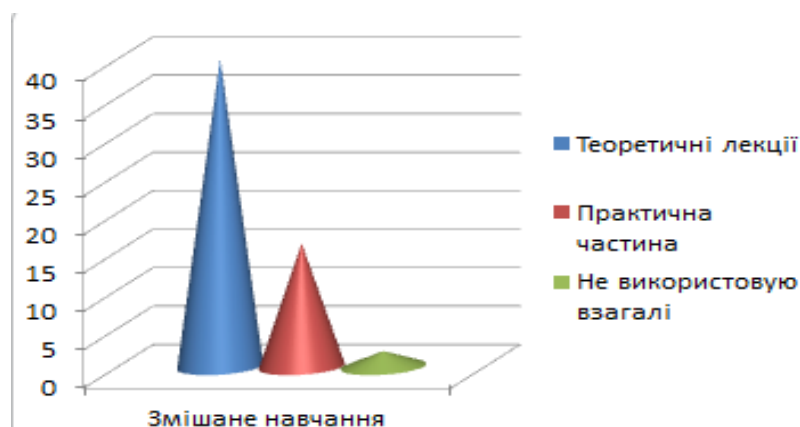
Рис. 2. Розподіл відповідей респондентів, щодо використання змішаного навчання в теоретичних, практичних лекціях.