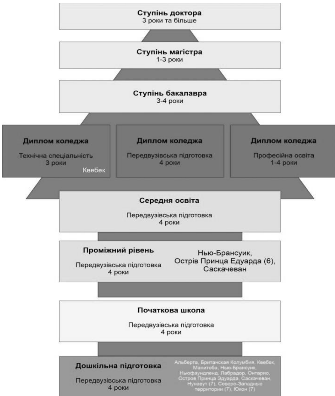
Рис. 1. Система освіти Канади