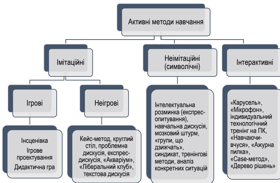
Рис. 2. Систематизація методів за характером освітньо-пізнавальної діяльності