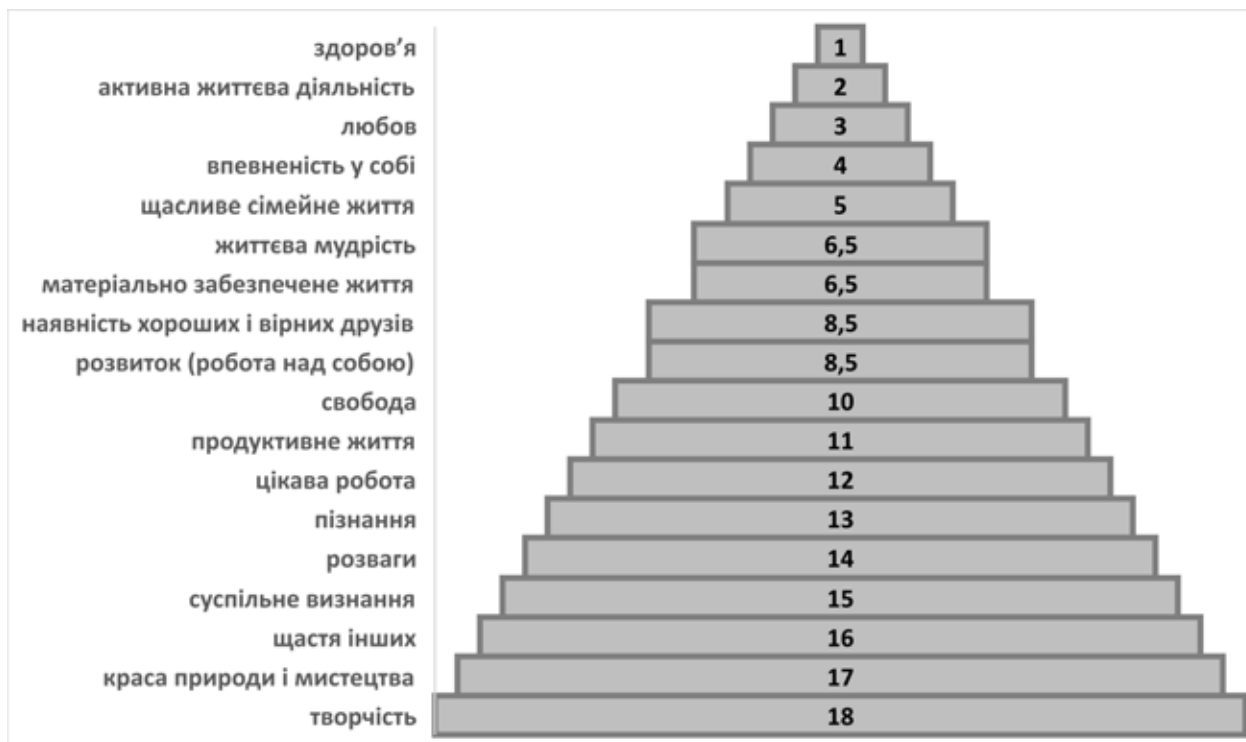
Рис. 1. Ієрархія ціннісних орієнтацій (термінальні цінності) студентів