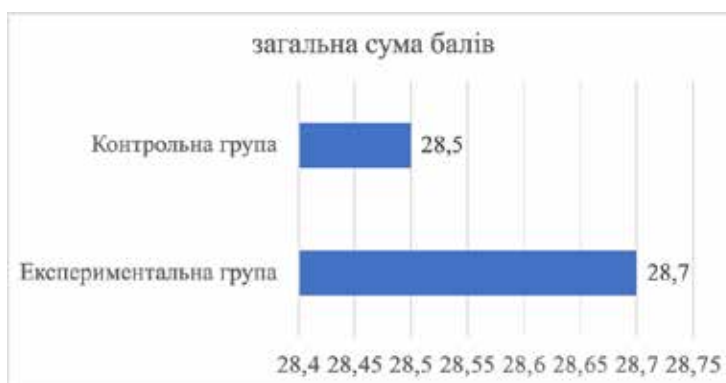
Рис. 2. Загальна сума балів за всіма складниками сформованості мовлення у дітей експериментальної та контрольної групи на констатувальному етапі дослідження

2. Розроблені комплекси ігрових завдань та ігор, прийомів та форм, які забезпечують