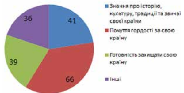
Рис. 2. Відповіді респондентів