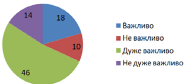
Рис. 1. Відповіді респондентів